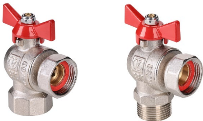
КРАН ЛАТУННЫЙ ШАРОВОЙ УГЛОВОЙ, УКОРОЧЕННЫЙ, С НАКИДНОЙ ГАЙКОЙ